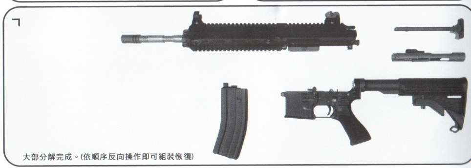
大部分解完成。(依順序反向操作即可組裝恢復)