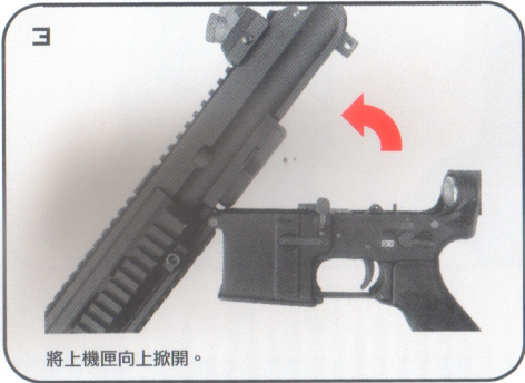
將上機匣向上掀開。