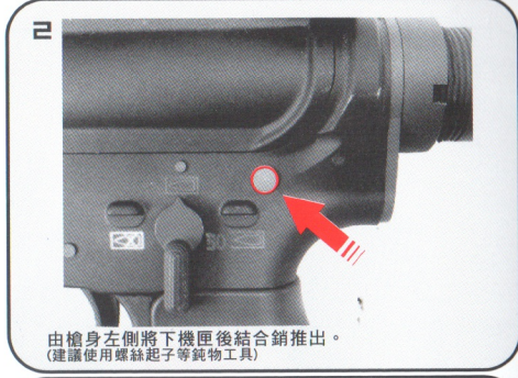
由槍身左側將下機匣後結合銷推出。 (建議使用螺絲起子等鈍物工具)