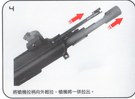
將槍機拉柄向外輕拉，槍機將一併拉出。