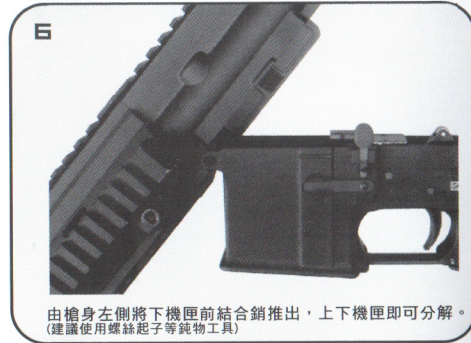
由槍身左側將下機匣前結合銷推出，上下機匣即可分解。 (建議使用螺絲起子等鈍物工具)