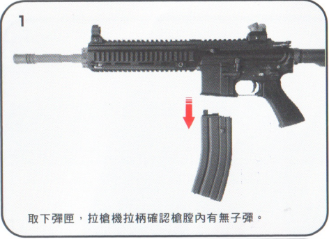
取下彈匣，拉槍機拉柄確認槍膛內有無子彈。